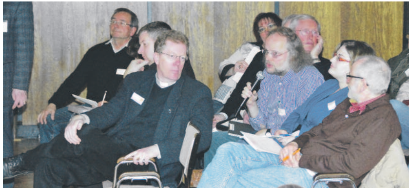
Im Gespräch... Einblick in die Arbeitsgruppe auf Maria Rosenberg

Es muss eine eindeutige Beschreibung und Zuordnung von Aufgaben und Rechten der beiden Gre-